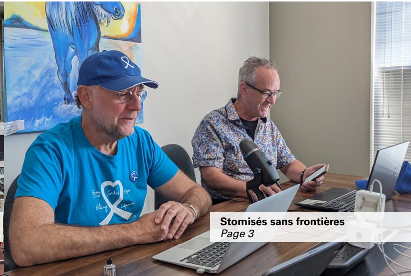
Stomisés sans frontières Page 3