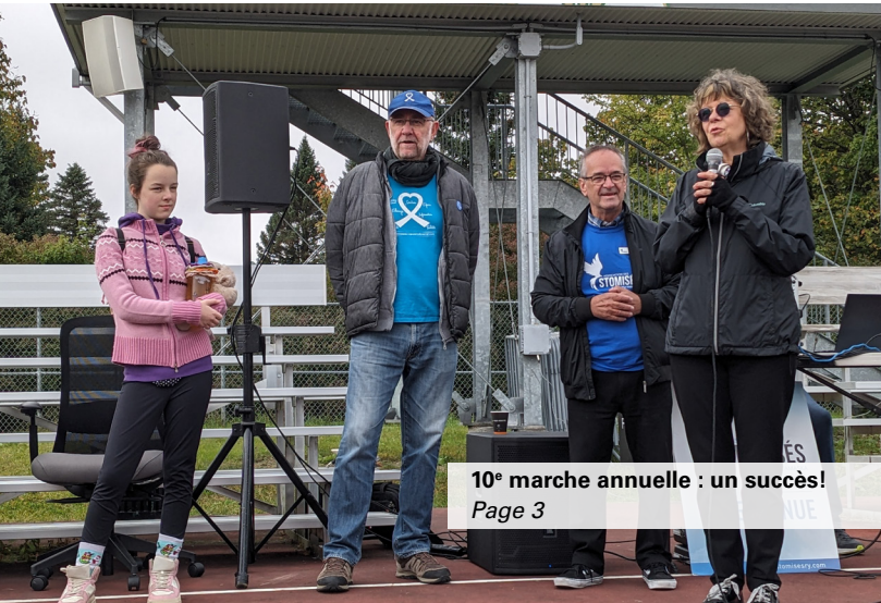
10 e marche annuelle : un succès! Page 3